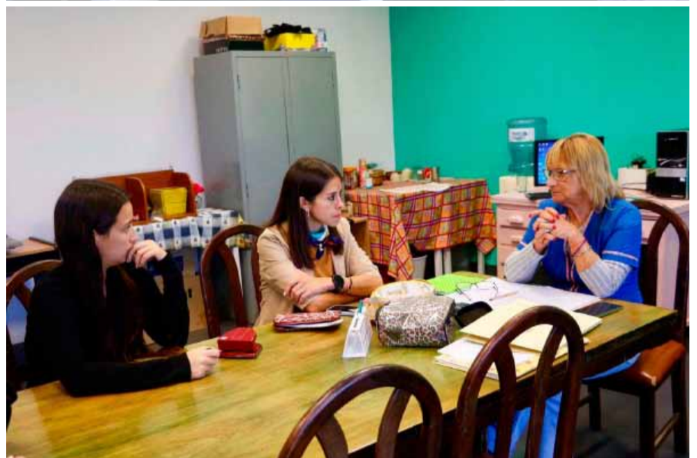
comunitarios que abordan problemáticas complejas

desde una mirada humana, cercana y comprometida con el bienestar de los vecinos y vecinas. Quienes quieran conocer