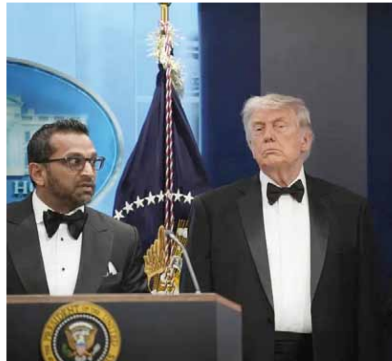
De urgencia. Conferencia de prensa en la Casa Blanca.

Donald Trump exigió la finalización inmediata del salón de baile que ordenó construir en la Casa Blanca. En la red Truth Social, argumentó que el incidente refuerza la necesidad de contar con un espacio de mayor seguridad dentro del complejo presidencial. - DIB -