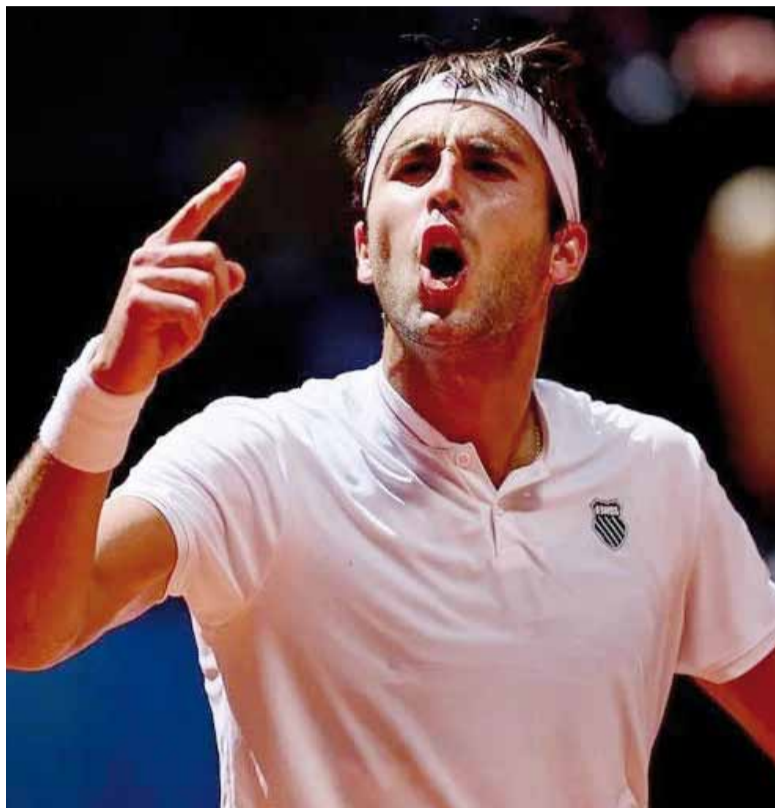
Imponente. El platense dio una muestra de carácter en la "Caja Mágica".

Ya en el tramo final, Etcheverry mostró su mejor versión. Rápidamente consiguió un quiebre en el inicio y luego amplió la diferencia para colocarse