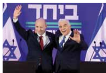
Unen fuerzas. Naftali Bennett (izq.) y Yair Lapid, aliados.

Netanyahu regresó al cargo en diciembre de 2022 después de elecciones anticipadas y encabezó lo que los críticos llaman el Gobierno más ultraderechista en