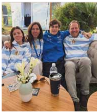
Un sueño. María ilusiona al país.

El contexto alimenta la expectativa. Inter Miami tiene compromiso el sábado y podría contar con jornada libre el domingo, justamente cuando el pilarense tendrá actividad. Esa coincidencia de calendarios mantiene abierta la posibilidad de un encuentro. Por ahora, la foto sigue en suspenso, pero cada nueva señal del calendario deportivo la vuelve un poco más cercana, en una de las postales más esperadas por los fanáticos.