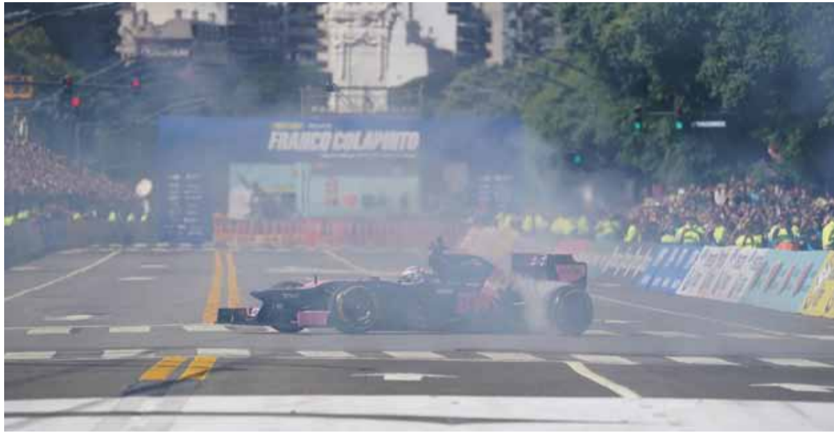
Atracción. Franco completó pasadas, derrapes y aceleraciones ante miles de espectadores.

Las declaraciones acompañaron un evento simbólico para el automovilismo argentino: el paso del F1 por las calles porteñas tras 14 años, con el piloto girando ante una multitud en Palermo. Una imagen que reforzó su proyección y lo consolidó como protagonista central del presente de la categoría.