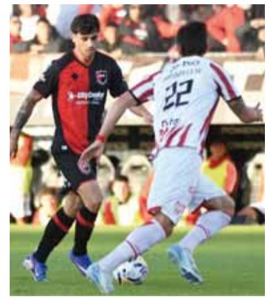
Paridad en el Coloso de Rosario.