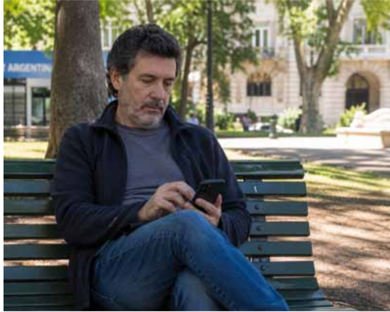
Problemático. La suba de tasas en el último trimestre de 2025 enciende alarmas. - IA -

Al evaluar los motivos que propiciaron la suba de la morosidad, el análisis del JP Morgan señaló, por un lado, que a diferencia de lo ocurrido en México o Brasil, Argentina registró fuertes incrementos en las tasas de interés du-