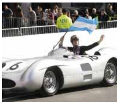
Franco manejó el W196.

Colapinto se fundió en un abrazo simbólico con la historia grande de nuestro automovilismo al ponerse al mando del Mercedes-Benz W196, la mítica "Flecha de Plata" con la que Juan Manuel Fangio grabó su nombre en la eternidad.