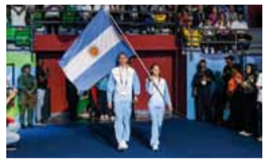
La delegación cosechó 105 preseas.

La Maratón de Londres 2026 quedó en la historia del atletismo: el keniano Sebastian Sawe rompió el récord mundial con un impactante 1:59:30 y se convirtió en el primero en bajar las dos horas en competencia oficial. Detrás, el etíope Yomif Kejelcha marcó 1:59:41, segundo mejor registro de todos los tiempos, mientras que el ugandés Jacob Kiplimo fue tercero con 2:00:28. En mujeres, Tigst Assefa volvió a ganar con 2:15:41 y mejoró su propio récord.